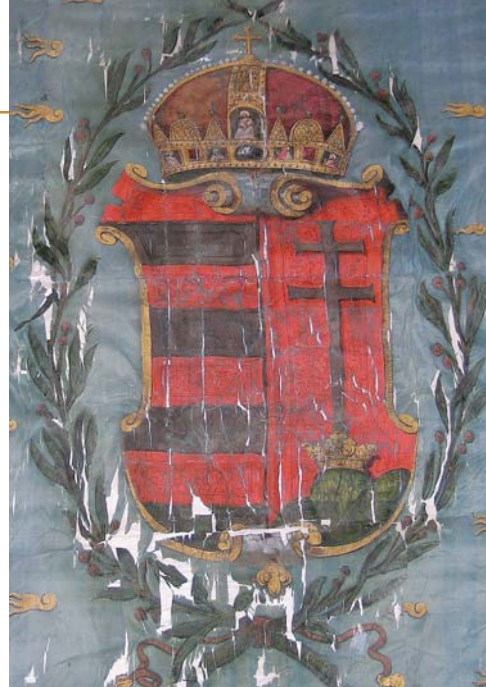
A SZENT KORONA A MAGYAR KIRÁLYSÁG CÍMERÉN II. FERDINÁND MAGYAR KORONÁZÁSI ZÁSZLAJÁN (1618, POZSONY)

nyeket. A szabályozás ellenére a korona története bővelkedett kalandokban a középkor folyamán. A tatárok elől a dalmáciai Trau várába mentették a királyi családdal együtt. 1301-ben a cseh Vencel székesfehérvári koronázását követően Csehországba vitték, onnan pedig a bajor Ottóhoz került. A Képes Krónika szerint ekkor történt a nevezetes eset, hogy a csobolyóba rejtett korona leoldódott a nyeregkápáról, és az útra hullt, míg a következő napon a megrémült kísérők meg nem találták. 1440-ben Visegrádról lopta el a koronát Kottaner Ilona, és egészen 1464-ig, III. Frigyes császár kincstárában várta, hogy Mátyás hatalmas sarcért kiváltsa a drága ereklyét. Ennek következtében a Várnánál hősi halált halt I. Ulászló királyunkat nem is sike-