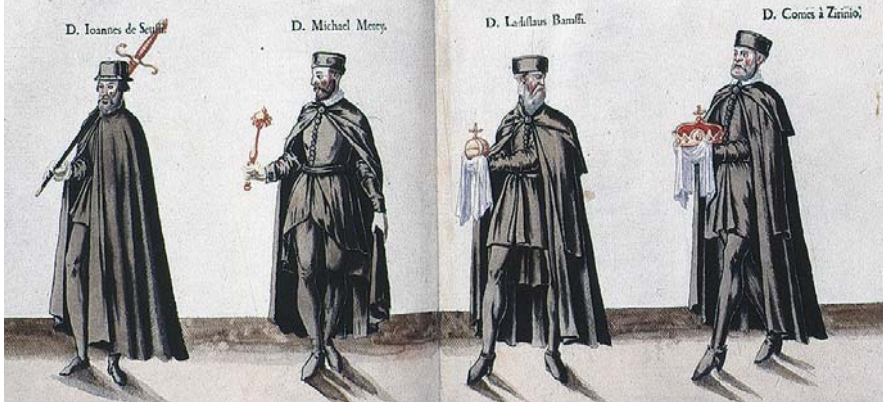
A SZENT KORONA EGYKORÚ MÁSOлата ZRINYI MIKLÓS KEZÉBEN I. FERDINÁND BÉCSI TEMETÉSI SZERTARTÁSÁN (1565)

rült megkoronázni. Rajta kívül János Zsigmond és II. József tartozik abba a körbe, akiknek nem érintette homlokát a korona. 1529-ben Szulejmán szerezte meg a Visegrádon őrzött koronázási jelvényeket, ő átadta Szapolyai Jánosnak, onnan pedig előbb Bécsbe, majd Pozsonyba került.