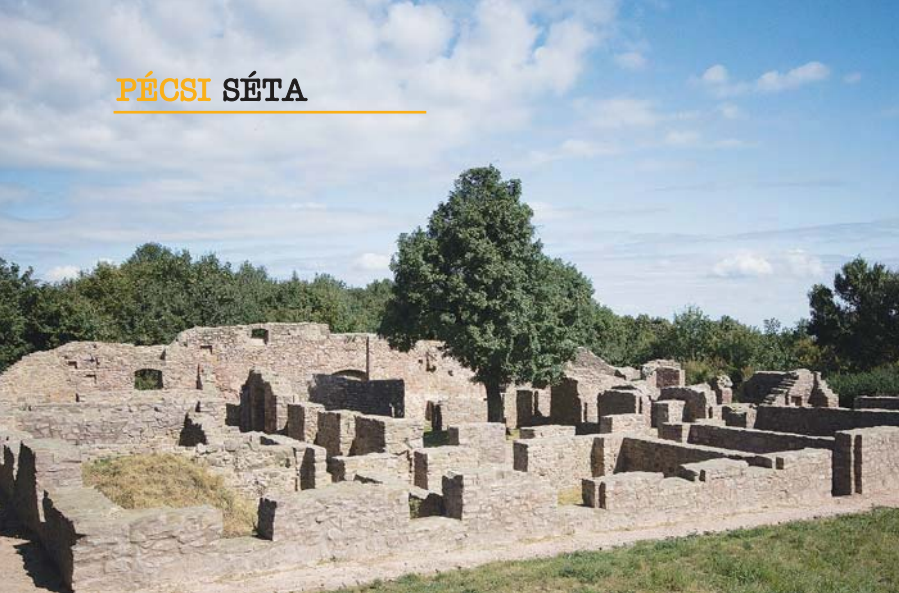
A PÁLOSOK EGYKORI SZENTÉLYÉNEK FELÚJÍTOTT ROMJAI A JAKAB-HEGYEN, ÉS MAI TEMPLOMUK A MAGASLATI ÚTON