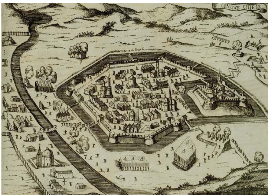
PÉCS TÖRÖK KORI TÉRKÉPE 1686-BÓL

Gázi Kászim-dzsámi. A legjelentősebb muszlim imahely a város főterén álló Gázi Kászim-dzsámi, amely a magyarországi török építészet legmonumentálisabb alkotása. Az épület méretei megdöbbentőek, hiszen a 18 méteres falhosszúság jóval meghaladja a határtartományokban megszokottat. Építetőjéről viszonylag sokat tudunk: délszláv