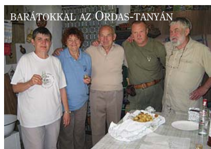
BARÁTOKKAL AZ ÖRDAS-TANYÁN

– Számomra a világ legszebb helye a Mecsek. A Kelet-Mecsek, azon belül Pusztabánya erdei a legkedvesebbek nekem, de nagyon szeretem a Jakab-hegy környékét is. Munka után megebédeltem, és már mentem fel a hegyre, sokszor aludtam a Zsongor-kő melletti Remete-barlangban. A magyar tájakat szinte