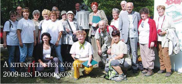
A KITÜNTETETTÉK KÖZÖTT 2009-BEN DOBOGÓKÓN

mind bejártam, de külföldön is sokfelé megfordultam. Szerettem az Alpokban túrázni, sokat csavarogtam az osztrák, német és francia alpesekben.