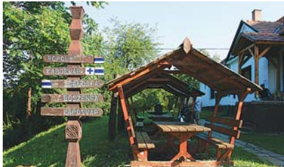
SIMONFA – METEOR TURISTAHÁZ