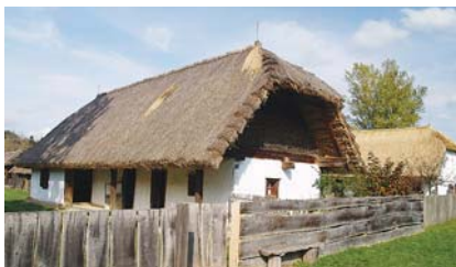
A SZENNAI SKANZEN

nehezen hagyjuk el ezt az „oázist”. Szilvásszentmárton után Patcára tartunk, ahol számos szálláslehetőséget találhatnak a turisták. Szennára huszonhat kilométerrel a lábunkban érkezünk meg. Itt nem hagyhatjuk ki a faluban található páratlan népi építészeti gyűjtemény (Europa Nostra-díjas skanzen) megtekintését.