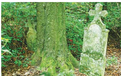
A TÓTVÁROSI TEMETŐ ÉVSZÁZADOS SÍRJAI

Harmadik napra vállaltuk a legtöbb gyaloglást (26 km), Simonfáról Szennára tartunk, ahol egy falusi vendégházban kapunk fedelmet a